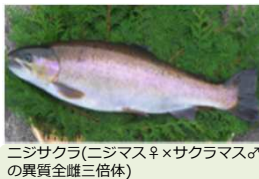
ニジサクラ(ニジマス♀×サクラマス♂の異質全雌三倍体)