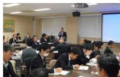
山形大学農学部との連携 推進協議会での研修会