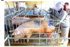
母豚のボディコン ディション確認