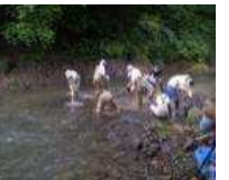
サクラマスの産卵場造成