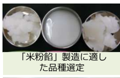
「米粉餡」製造に適し た品種選定