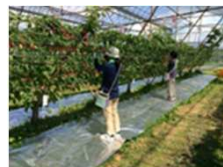
おうとうの省力化可能 な樹形「Y字」仕立て