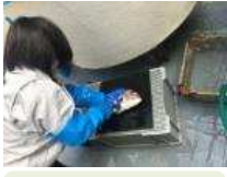
鮮度保持技術開発