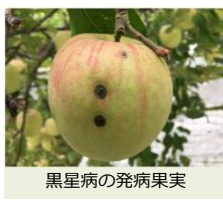
黒星病の発病果実