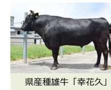
県産種雄牛「幸花久」