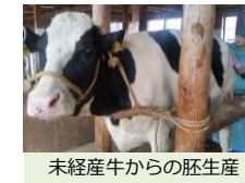
未経産牛からの胚生産