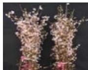
植物成長調整剤による啓翁桜の花芽着生向上