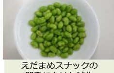
えだめめんの 開発に向けた試作