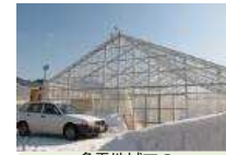
多雪地域での次世代型施設トマト栽培