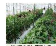
ダリアの挿し芽苗を用いた6～12月の生産性向上