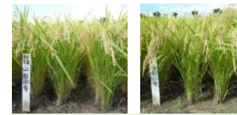
有望早生系統「山形137号」「山形139号」