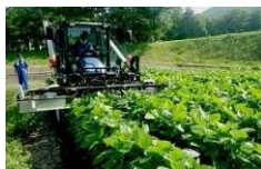
大豆の摘心機による 処理