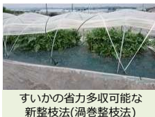
すいかの省力多収可能な 新整枝法(渦巻整枝法)