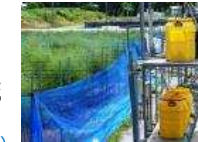
日射制御型拍動灌水装置を用いた技術確立