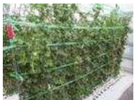
スナップエンドウ