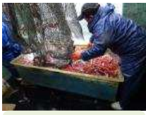
活紅エビ出荷技術開発