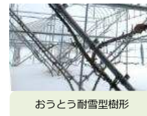
おうとう耐雪型樹形