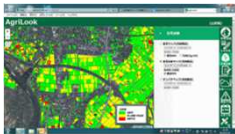
衛星画像による水稲の 生育診断