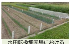
水田転換畑圃場における 野菜有機栽培