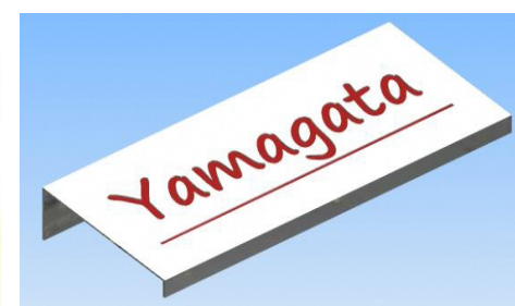
ネームスタンド(イメージ)