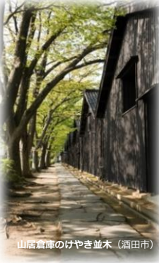
山居倉庫のけやき並木（酒田市）

また、自然を利用した低温倉庫として明治時代から現役の「山居倉庫」や、大正ロマン漂う優美なたたずまいを見せる旧県庁舎「文翔館」など、近代を代表する貴重な建築物の姿も随所にみることができます。