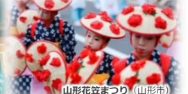
山形花笠まつり（山形市）