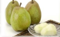
西洋なし「ラ・フランス」

これらは豊かな自然に加え、勤勉で何事にも真摯に向き合う山形の人々の努力の賜物です。