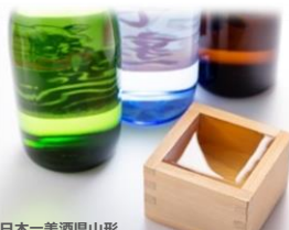
日本一美酒県山形