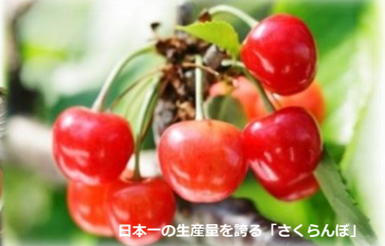
日本一の生産量を誇る「さくらんぼ」