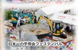
日本一の玩具会フェスティバル（山形市）