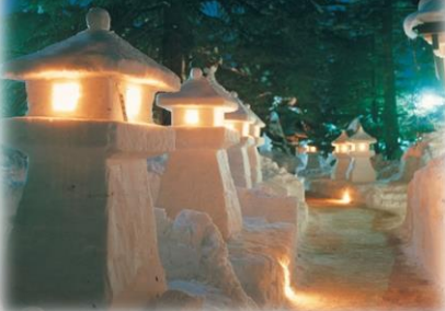
上杉雪灯籠まつり（米沢市）