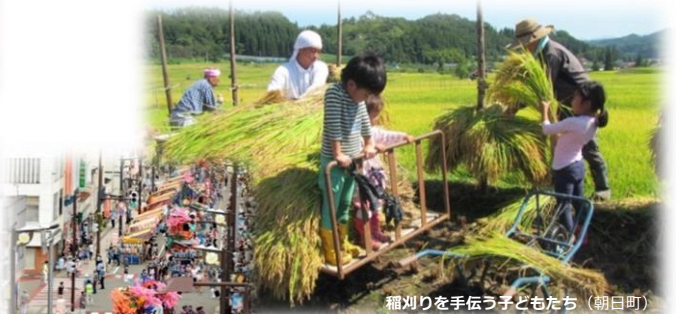
稲刈りを手伝う子どもたち（朝日町）