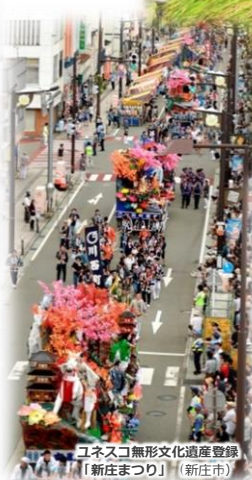
ユネスコ無形文化遺産登録「新庄まつり」（新庄市）