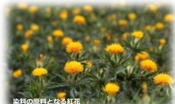
染料の原料となる紅花

何代にもわたって、粘り強く、ひたむきに向き合う姿勢を貫いてきたものづくりの歴史を大切にしながら、近年では、様々な分野が融合した超精密技術や先端技術の集積地として歩み出しています。