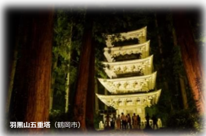
羽黒山五重塔（鶴岡市）