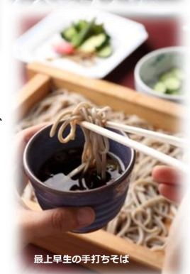
最上早生の手打ちそば