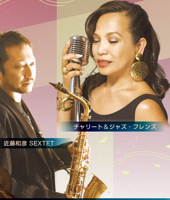
チャリット&ジャズ・フレンズ