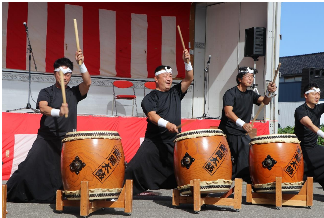
しょうない秋まつり(庄内町)