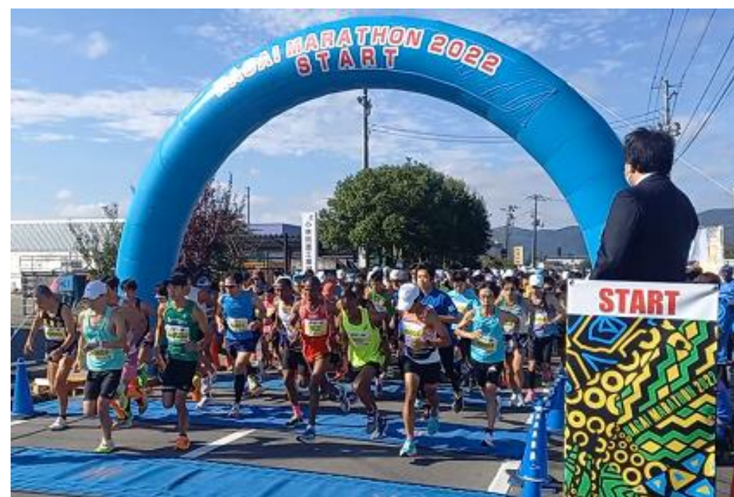
長井マラソン(長井市)