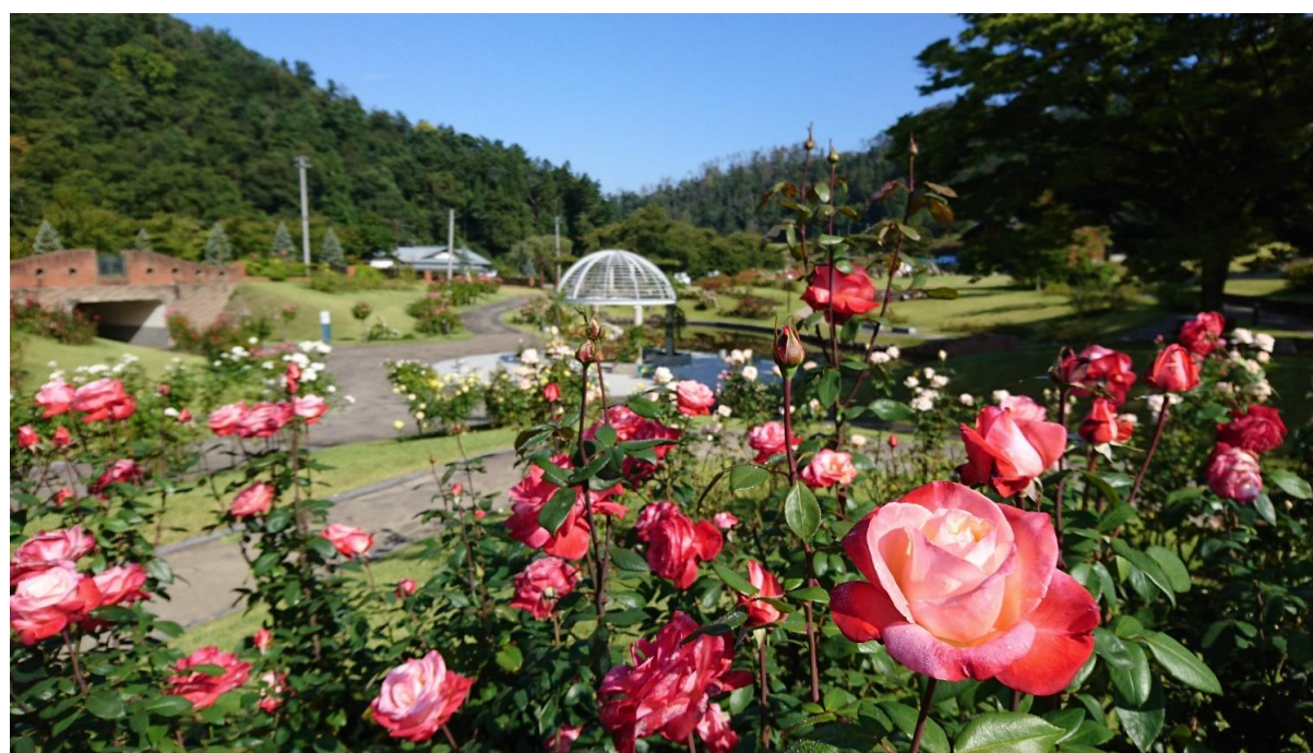
秋のバラまつり(村山市)