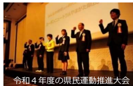
令和4年度の県民運動推進大会

⇒構成団体が県民の主体的な取組みを後押しするため、令和3年度に策定したカーボンニュートラルやまがたアクションプランに基づく取組みを推進