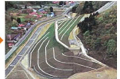
地すべり対策 （たいさく）かんせい

いろんな工事でわたしたちのくらしが守られているんだね。 でも、土砂災害（どしゃさいがい）がおきたらどうすればいいの？