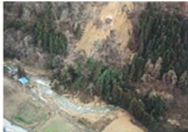
地すべり災害 （さいがい）はっせい