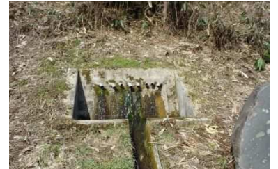
水路工（すいろこう）・横ボーリング