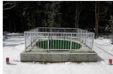
集水井（しゅうすいせい）