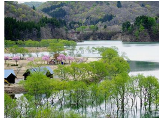
第38回全国白川ダム湖畔マラソン大会(飯豊町)