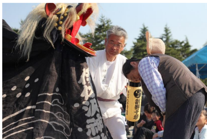
ながい黒獅子まつり(長井市)