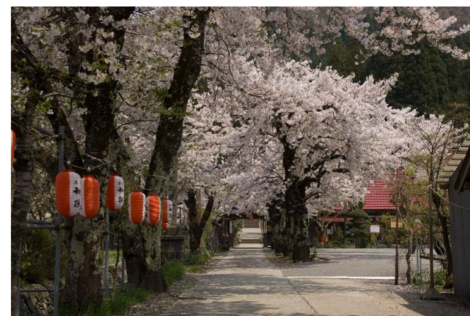
富山馬頭観音 春大祭(最上町)