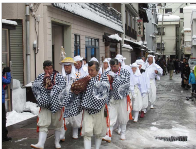
肘折さんげさんげ(大蔵村)