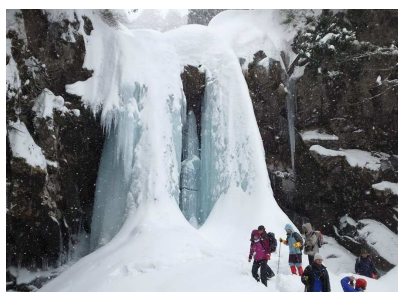
二ノ滝氷柱トレッキング(遊佐町)