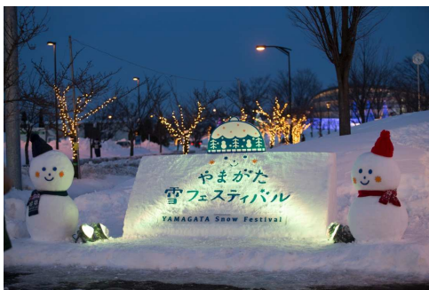
やまがた雪フェスティバル(寒河江市)