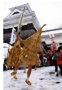
奇習「加勢鳥」(上市市) 民俗行事