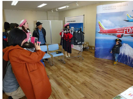
おいしい山形空港 ウインターフェスティバル(東根市)