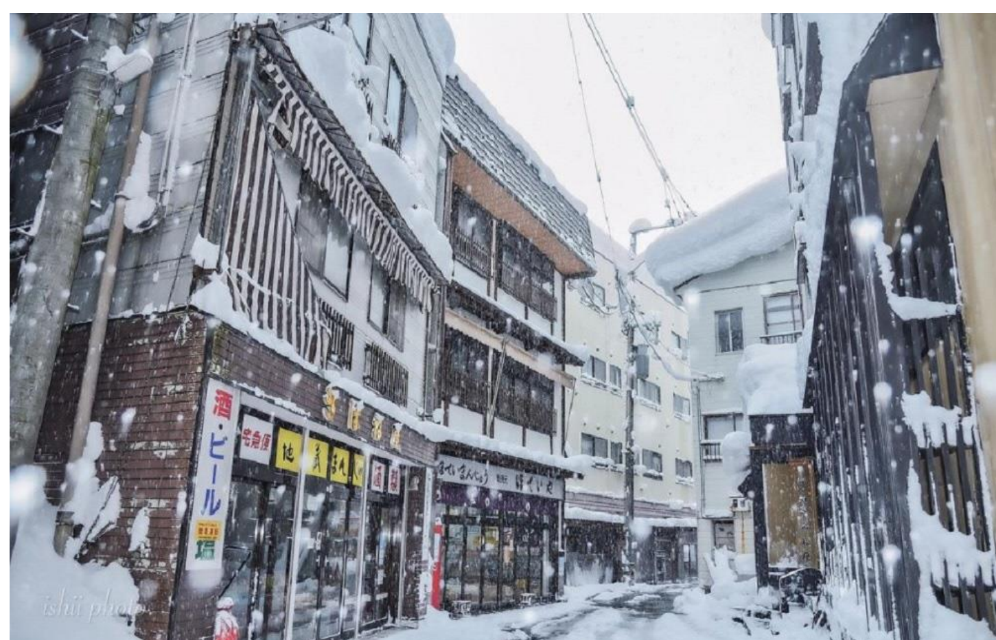
冬の肘折温泉街(大蔵村)