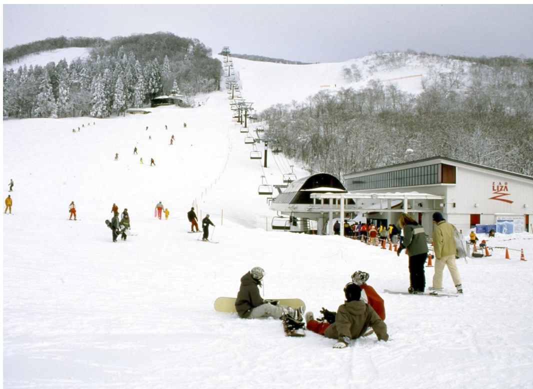
蔵王ライザワールドスキー場