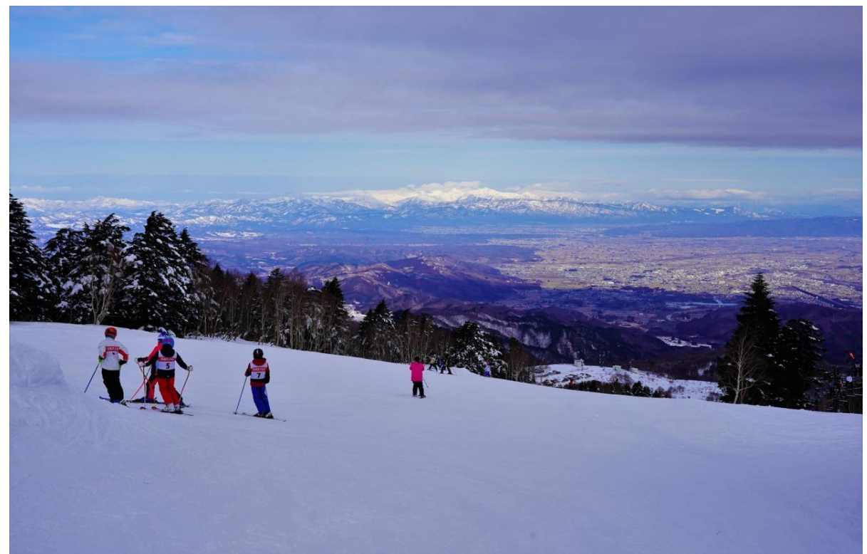
天元台高原スキー場