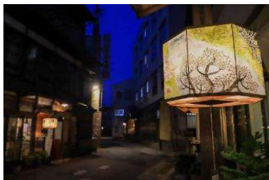
ひじおりの灯(大蔵村)