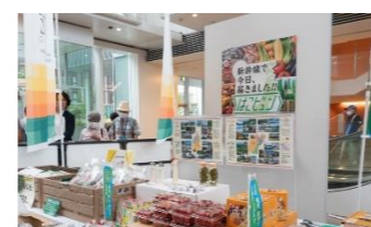
新幹線を活用した置賜地域の 果物等の輸送