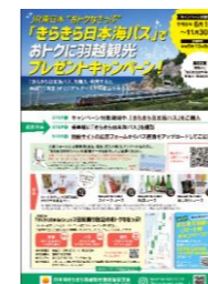
きらきら日本海パス キャンペーン