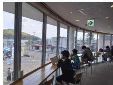
大江町交流ステーション（左沢駅併設）の コワーキングスペース整備