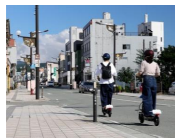
ゆめりあ 電動キックボード レンタル