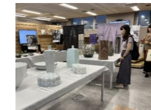
米沢駅コワーキングスペース を活用した工芸イベント