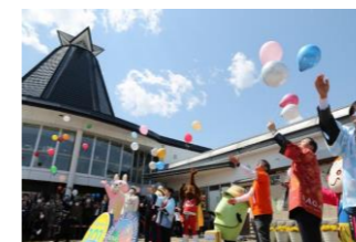
左沢線開通記念 101周年イベント