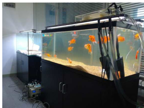
商品の引合いに向け、現在、ハルビン事務所内でもサンプルを展示中