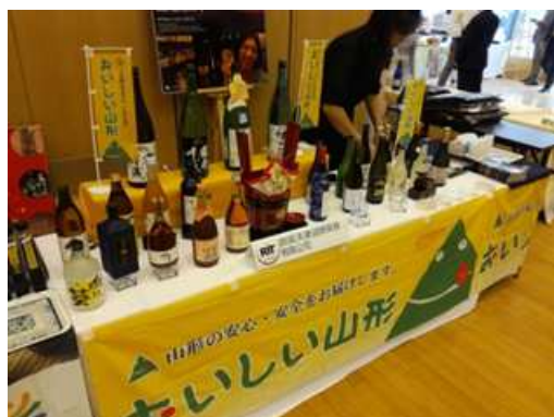
県産酒 PR の様子

また、大使館のブースでは、県産コシヒカリを使用したお米クッキー、お米ムース、だまっこ汁等が提供されました。