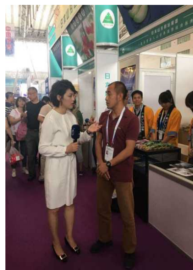
現地テレビ局 取材の様子

来年 2018 年は、山形県と黒龍江省の友好県省締結 25 周年の節目の年となります。黒龍江省の外事弁公室の方からも、ハルビン国際経済貿易商談会の山形県ブースを大いに盛り上げてもらいたい旨のお話がありました。来年の商談会は 6 月 14 日～19 日に開催される予定です。ご興味がありましたら是非ご連絡ください。