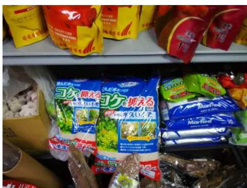
ハルビン市内小売店での陳列の様子 下段中央

ちなみに、当企業の鉱物資源を使った壁材は、ハルビン市内の日本料理店の一室でも採用されたところです。今後のハルビンでの商品 PR・販売拡大に繋がればと考えています。