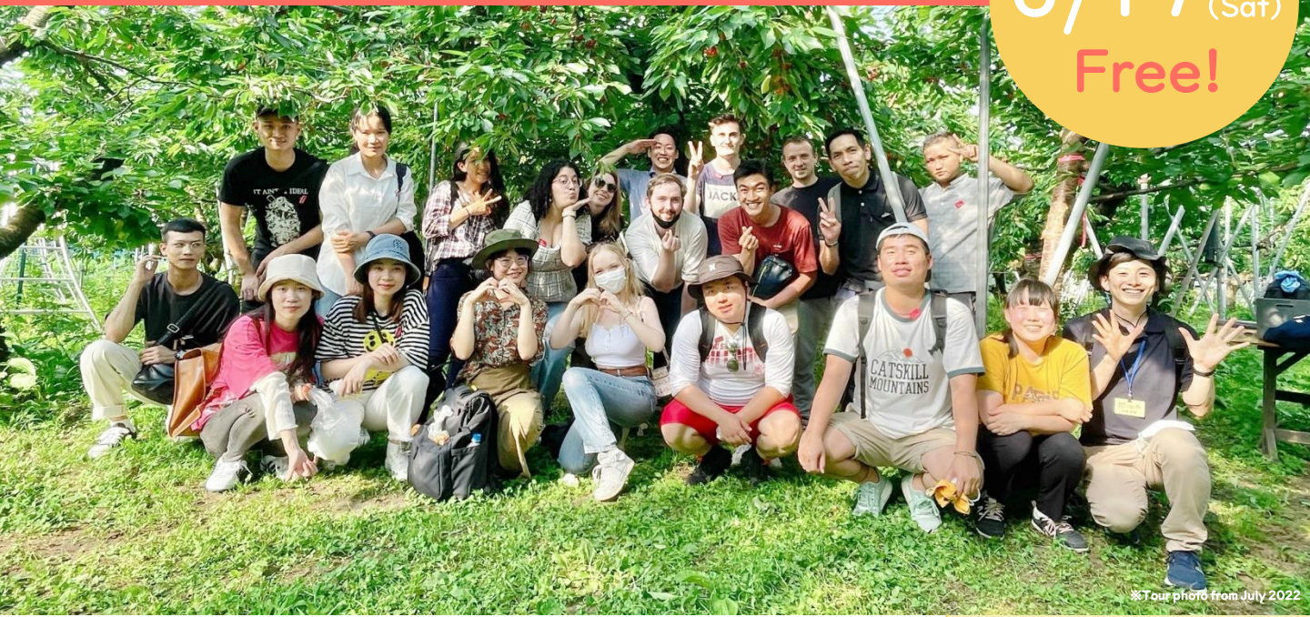
*Tour photo from July 2022