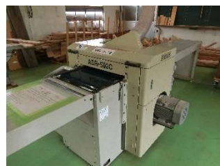
産業高校の設備の更新（かなな盤）