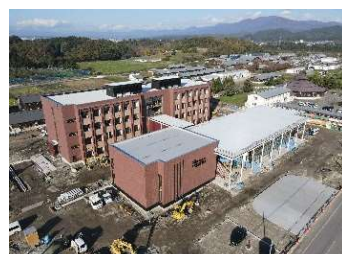
東北農林専門職大学の建設現場