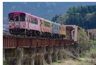
フラワー長井線 全線開通100周年記念イベント （ラッピング列車4両連結運行）