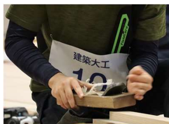
技能五輪全国大会（建築大工）