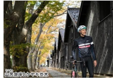
山居倉庫とケヤキ並木