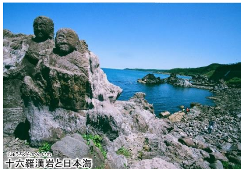
十六羅漢岩と日本海