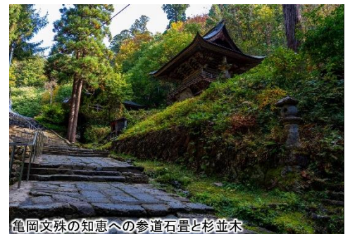
亀岡文殊の知恵への参道石畳と杉並木