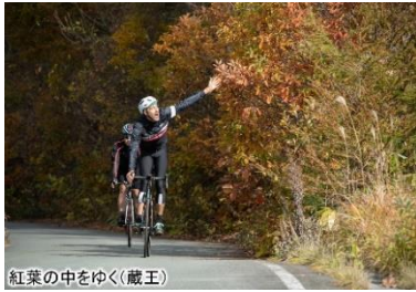
紅葉の中をゆく(蔵王)