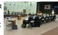
合成クモ糸繊維関連産業集積会議