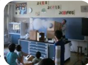
サイエンスナビゲーターによる科学教室