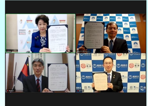
4者による協定締結式