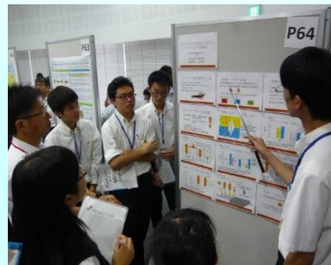
高校生バイオサミットの様子