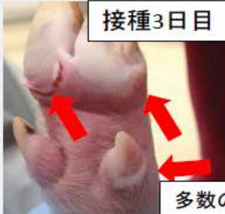
多数の水疱病変を確認