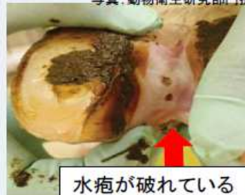
水疱が破れている