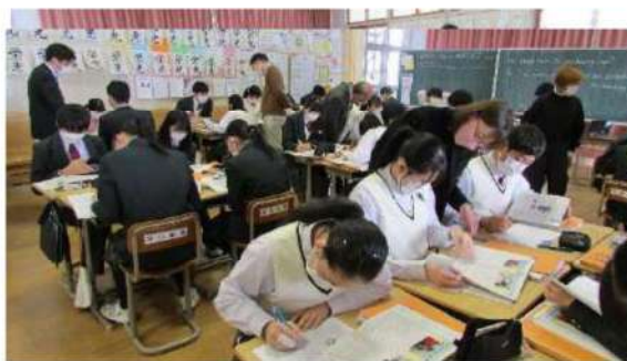
英語の授業では、ALTや市の学力向上支援員が加わると最大5人の指導者が教室に入り、支援することもある。