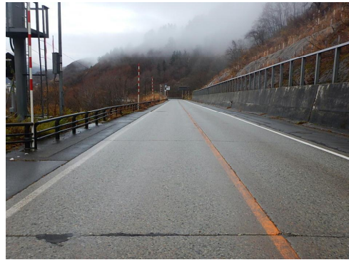
【Aの進行方向から見た現場の状況】