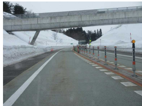
【Aの進路方向から見た現場の状況】