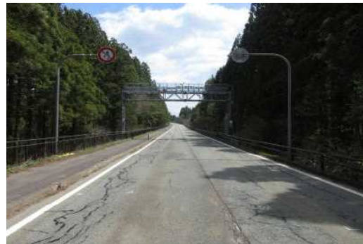
【Aの進行方向から見た現場の状況】