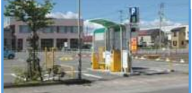
駅前駐車場のJR利用者割引(寒河江駅)