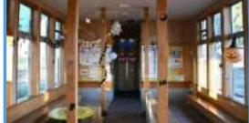
駅コミュニティ施設(羽前長崎駅)