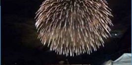
水郷大江夏まつり灯るう流し花火大会 (左沢駅)(R6.8.15)