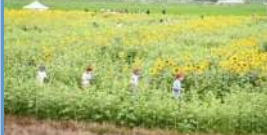
ひまわり迷路(羽前長崎駅)