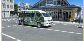
駅からの二次交通(かみのやま温泉駅)