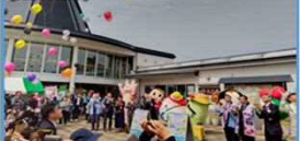
やまがたあてらさわ102フェス(左沢線) (R6.4.27)