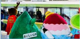
さくらんぼSATONO号運行時のおもてなし (山形駅)(R6.6.15)