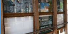
「好きです、中山」ファンクラブ 地元中学校美術部による装飾(羽前長崎駅)