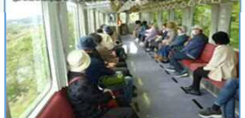
左沢線乗車体験(旅行ツアー行程の一部) (R6.5月、6月、10月、11月)