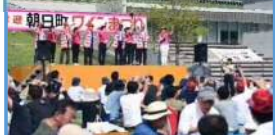
朝日町ワインまつりサドルバス運行 (寒河江駅、左沢駅)(R5.9.23)