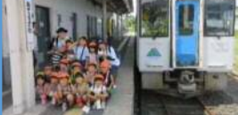
幼児等々の左沢線利用促進