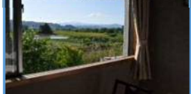
ひまわり温泉ゆ・らら 「トレインビュー和洋室」(羽前長崎駅)