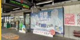
季節のタペストリー展示 (かみのやま温泉駅)