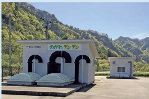
野川小水力発電所 (長井市)