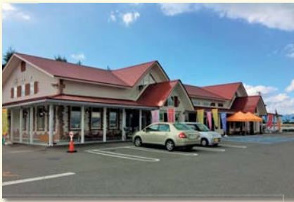
かわにし森のマルシェ (農産物直売所)