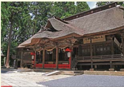
熊野大社 (縁結びのパワースポット)