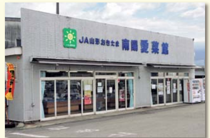
南陽愛菜館 (農産物直売所)