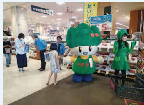
街頭啓発活動の様子

県ではごみゼロやまがた県民運動の一環として、「ごみゼロの日」である平成29年5月30日に、県内4カ所の大型商業施設において、「ごみゼロやまがた県民運動キャンペーン」として家庭でのごみの削減を呼びかける街頭啓発活動を行いました。