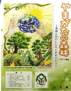
小学校5年生向けの副教材