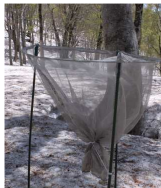
ブナ・ナラ豊凶調査