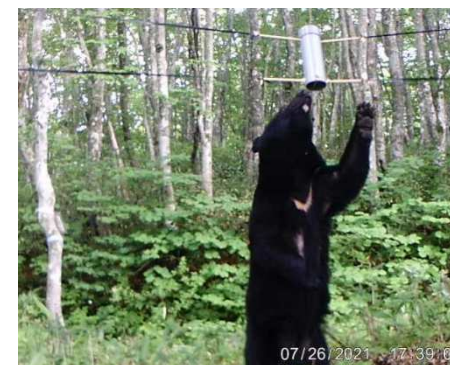
ツキノワグマ生息状況調査