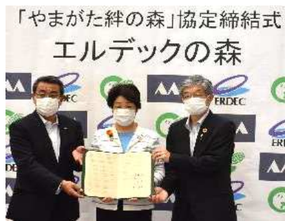
「やまがた絆の森」協定式