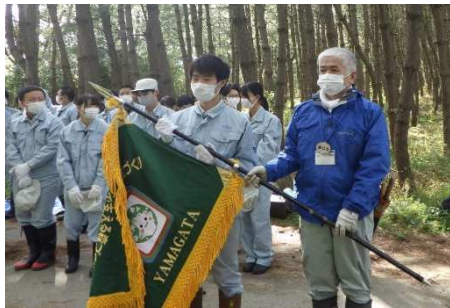
森づくりをつなぐリレー旗