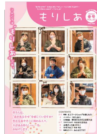
やまがた緑環境税 広報誌