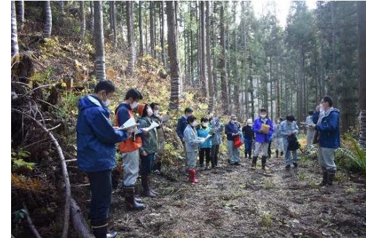
やまがた緑環境税評価・検証 委員会（現地視察）