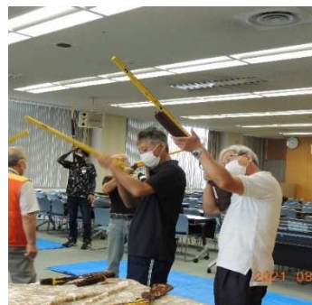
狩猟免許試験 準備講習会