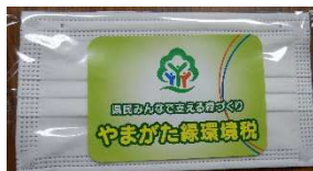
普及啓発 物品(マスク)