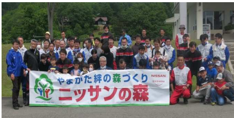
絆の森参加企業による森林整備活動集合写真