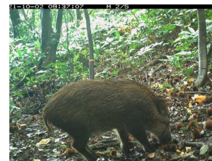
里山に出没する大型野生 鳥獣生息動向調査