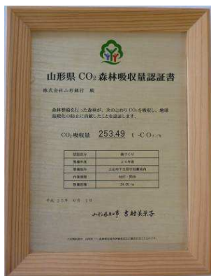
CO 2 森林吸収量 認証書