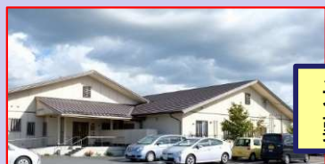
メディフル藤田、藤田東館