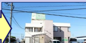
ながい内科クリニック