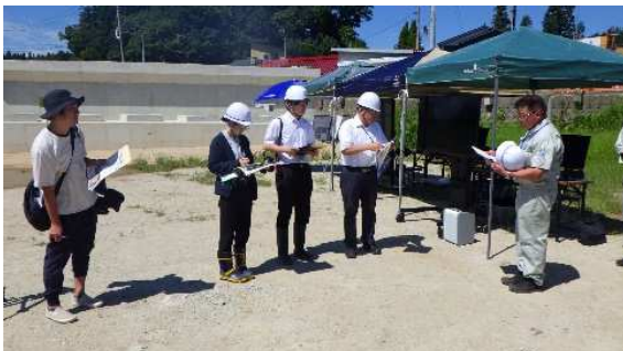
見学会の状況(大巻橋周辺)