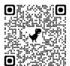
空撮動画のQRコード (県HPへのリンク)

前号でお知らせした空撮動画について、9月初旬にも新たな動画を公開する予定です。右のQRコードまたは県のホームページ(裏面に記載)から、ぜひご覧ください！！