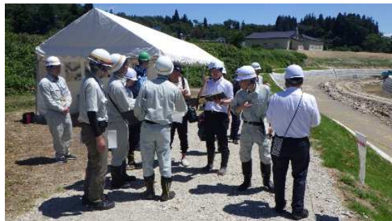
工事現場の説明状況(大天伯橋周辺)