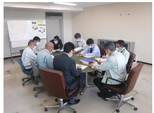
連絡調整会議開催状況(R5.4.25)

令和4年8月豪雨災害の早期復旧に向け、令和5年4月より置賜総合支庁西置賜地域振興局内に「県南豪雨災害復旧対策室」を13名体制で新設しました。関係課(西置賜河川砂防課、西置賜農村整備課、西置賜道路計画課)が一体となり、災害復旧事業を総合的に推進していきます。