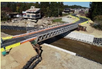
大巻橋仮設橋 (令和4年10月撮影)