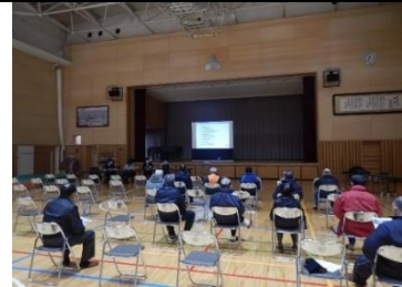
住民公聴会の様子(12月20日)

住民公聴会及びパブリックコメントでいただきましたご意見は、河川整備計画の参考にさせていただきます。