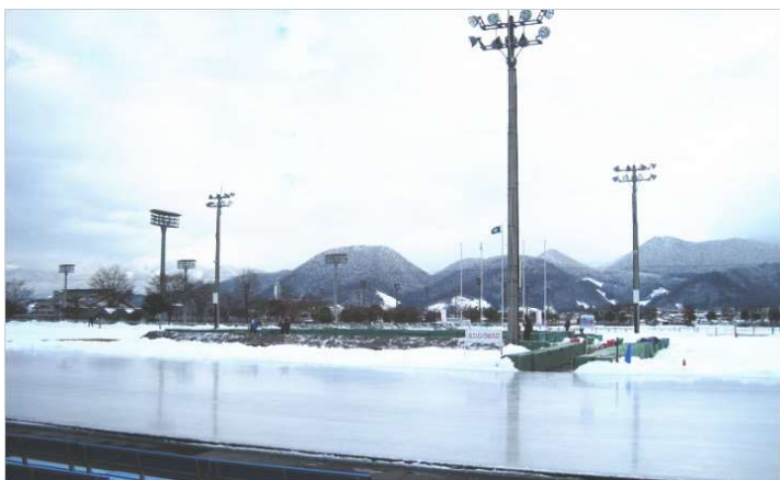
【山形市総合スポーツセンター】