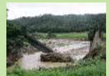
JR米坂線小白川橋梁

令和4年8月3日から4日にかけての豪雨災害により、置賜地域をはじめ県内各地で甚大な被害が発生しました。被害にあわれた皆様に心よりお見舞い申し上げます。鉄道施設においては、JR米坂線の橋梁が崩落するなど大きな被害が発生し、現在も一部区間がバス代行輸送となっており、住民生活に大きな影響を及ぼしています。被災した皆様が日常生活を一日も早く取り戻すことができるよう、県としても、全力で取り組みます。