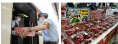
山形新幹線に積み込む様子 当日午後から販売開始

また、開業30周年に先駆けて、6月19日には、山形新幹線を活用したさくらんぼの荷物輸送を行いました。輸送したさくらんぼは、日本橋三越本店で開催した「第66回とっておきの山形展」(6月15日～20日)において販売・PRを行いました。