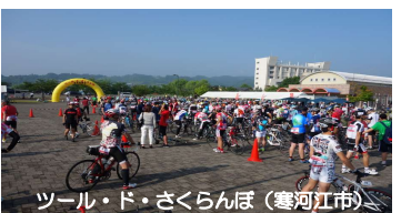
サイクリングスポーツの振興