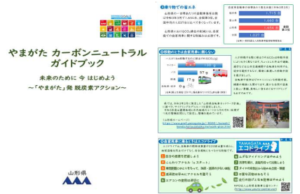
自転車を含めたエコ通勤を周知