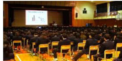
学生への交通安全指導 (イメージ)