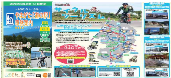
やまがた「道の駅」車旅案内