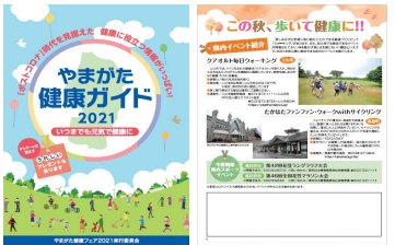
ガイドブック等で自転車を活用した健康づくりを広報啓発