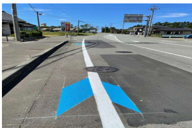
路面表示 (矢羽根) の設置