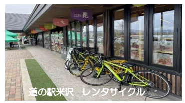
観光立寄施設等の受入環境の向上