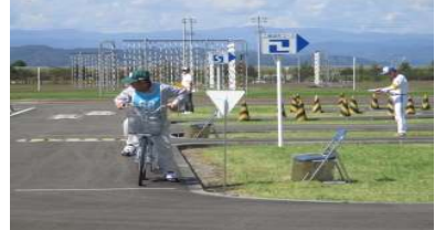
交通安全教室の開催等を推進