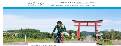
山形県公式観光サイト「やまがたへの旅」内専用サイトでの情報発信