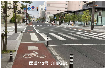
自転車通行空間の整備