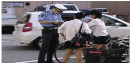
自転車利用者への交通指導 (イメージ)