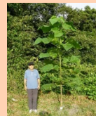
5月植栽の早生桐 人物は身長170cm