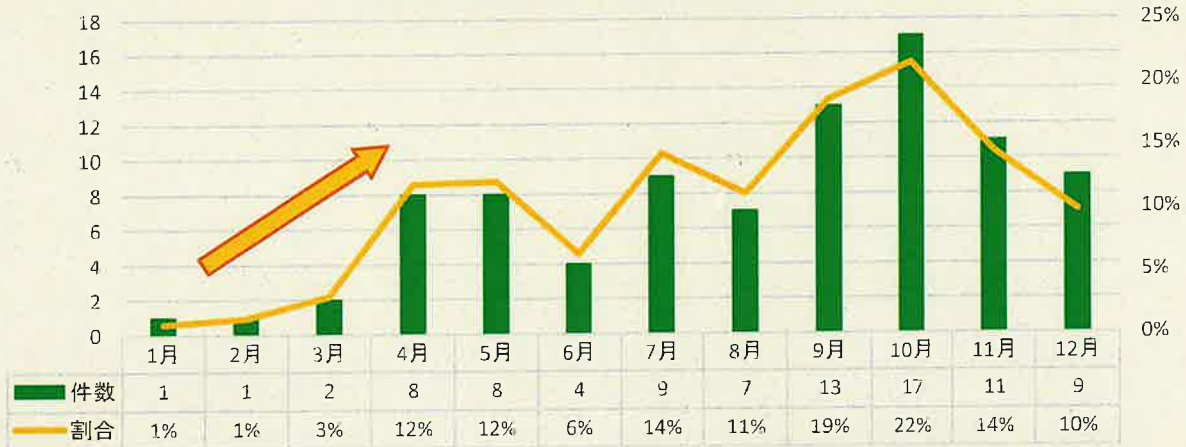
令和4年中の自転車事故月別発生状況