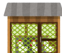
金網・ネット等の 点検および修繕