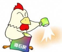
家きん舎周囲への 消石灰散布