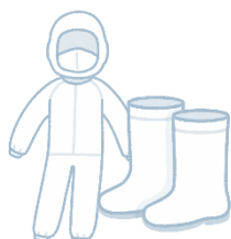
家きん舎専用 衣服・靴の使用