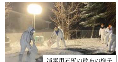
消毒用石灰の散布の様子

※獣医師は、中央家保及び置賜家保から各2名の計4名応援 ※埋却場所の掘削は、県建設業協会に委託