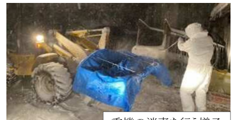
重機の消毒を行う様子