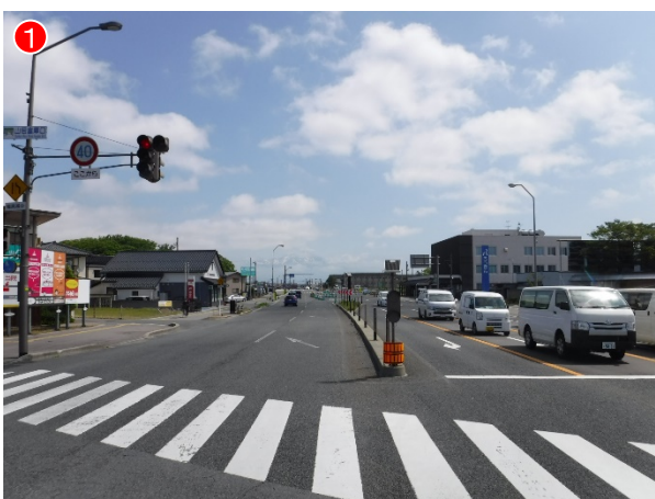
▲起点側 現況整備状況 (R3.6.1)