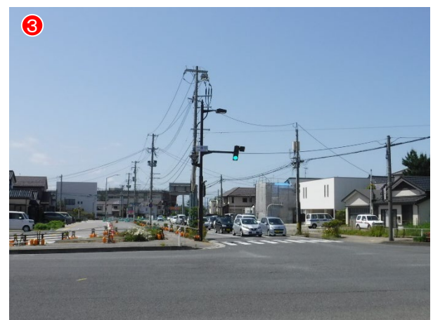
▲終点側 現況整備状況 (R3.6.1)