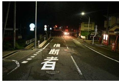
【本件事故現場の状況】