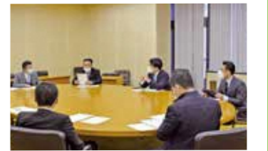
県議会デジタル化推進会議の様子