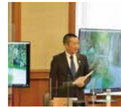
ディスプレイを使った 質疑の様子

12月13日、予算特別委員会で可動式ディスプレイを使った質疑が試行されました。議会のデジタル化の一環として、県議会デジタル化推進会議が試行したもので、映像資料を用いて質疑をよりわかりやすく見せる工夫を行いました。