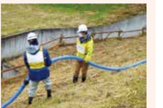
簡易放流装置修繕