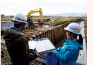
業者との現場確認

土木職でも女性技術者が増えており、女性ならではの悩みも先輩方に相談しやすいです。現場には女性用の快適トイレも設置されているため、性別関係なく仕事ができる環境が整っています。また、様々な部署で幅広く社会基盤の構築に関わりながら、自らの技術的な知識を増やすことができるのも魅力です。