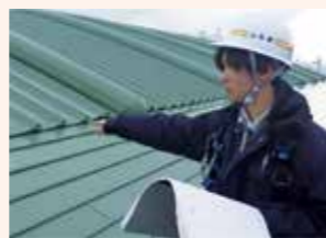
屋根改修工事の現場確認

建築職の業務は、図面の審査や県有施設の工事、住宅取得の支援等幅広くあります。建築の知識を生かし広い視野から県民の皆様が暮らしやすいように支援できることが建築職の魅力だと思います。ぜひ一緒に県職員として働きましょう。