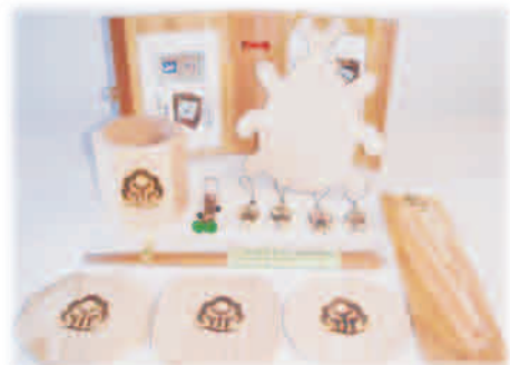
プレゼントイメージ