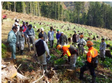
山の活動体験事業【鶴岡市】