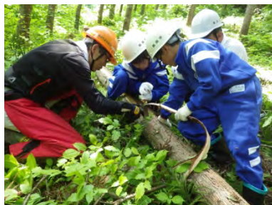
つるおかの森環境教育 推進事業【鶴岡市】