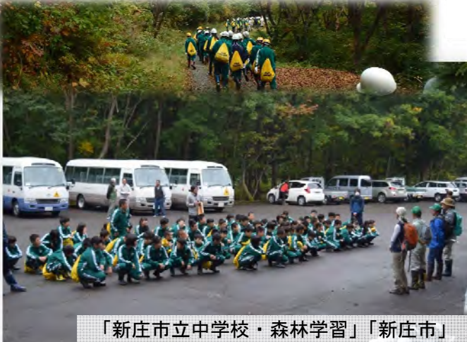
「新庄市立中学校・森林学習」 「新庄市」