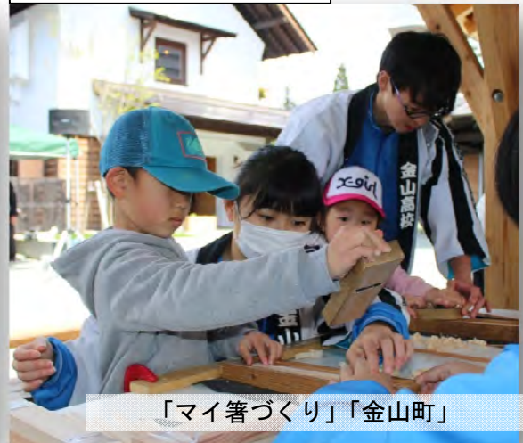
「マイ箸づくり」 「金山町」