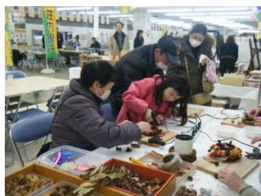
家づくり相談会【酒田市】