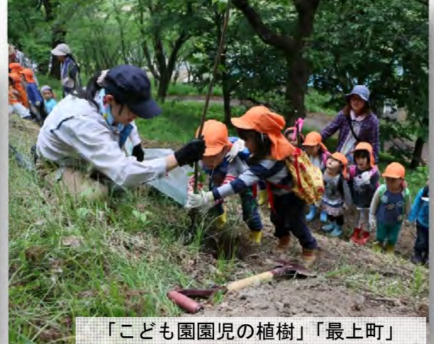
「こども園園児の植樹」 「最上町」