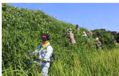
庄内自然博物館構想 推進事業【鶴岡市】