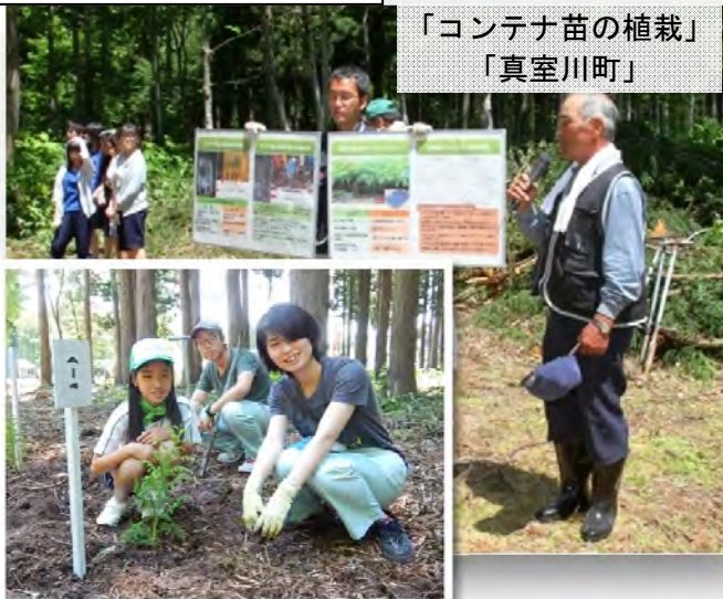
「コンテナ苗の植栽」 「真室川町」