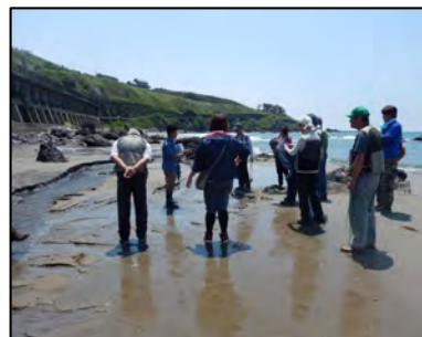
水と緑の森林づくり 推進事業【遊佐町】