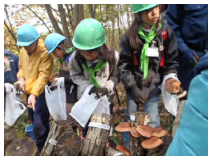
秋の森林教室【酒田市】