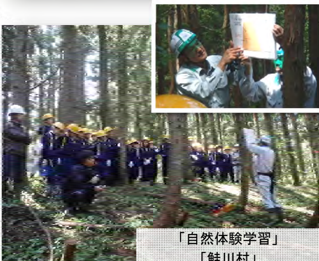
「自然体験学習」 「鮭川村」