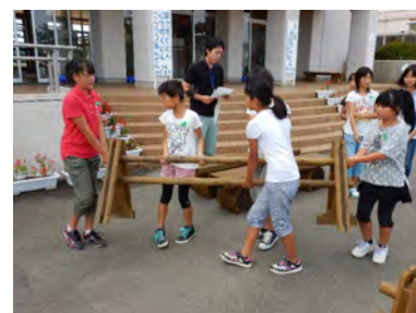
みかわ木育推進事業 【三川町】