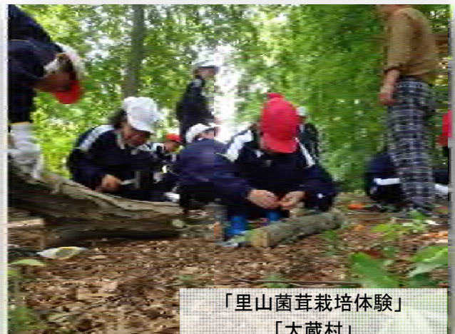
「里山菌茸栽培体験」 「大蔵村」