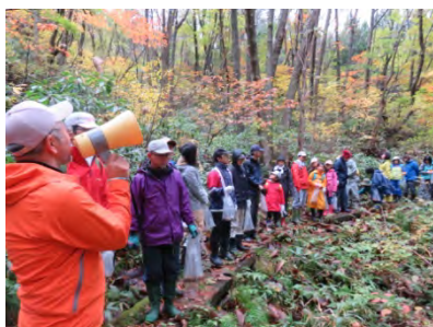
つるおか広葉樹の森 再生事業【鶴岡市】