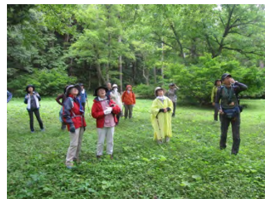
森林文化都市構想 推進事業【鶴岡市】