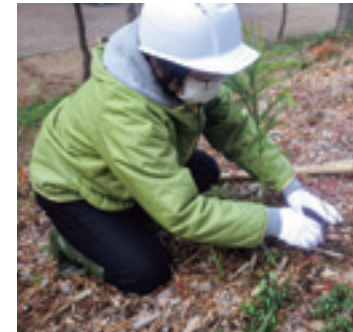
100年物の材を目指して!!

活動を継続していくことです。ブナを使ってイスを造る。ブナだっけで植えて2年で使えるようになるわけではないんですよ。現在、弊社で使っているブナ材の樹齢は数十年から約100年で、イスの背もたれや座面を1枚の板で作ることができるよう板が取れます。