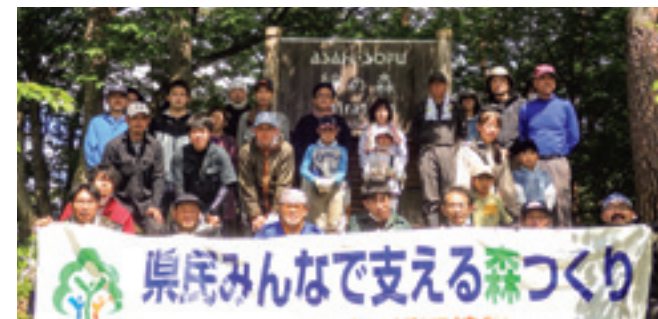
これからも活動を続けていきます!!

私たちは、そのような材が欲しいわけですね。そして、100年かけて育った木を使って製品を造るなら、その製品も100年間持つようにしたい。安いイスなら直さずに買い替えたりしますが、値の張るイスであれば修理しながら大事に長く使う。親から子へ、そして孫へずっと使い続けていくような使い方がいいと思うんですよ。いつかそのような100年物のブナ材をこの森林から切り出せるといいなあと思いつつ、今後も活動を続けていきます。