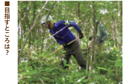
下刈りを頑張る職員

ほぼ義務みたいなのなので(笑)。大変だけど、木を植え、育てるにはこんなにも時間と手間が必要だと身をもって理解してもらえ、貴重な体験だと思っています。