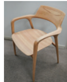
県産のブナ材で造られた椅子

私たちは、木、特に広葉樹を使って家具を造るものですが、ブナ林の保全をしたいと考えていたところ、県から絆の森のお話があり、それがきっかけとなりました。本来は会社がある朝日町で活動したかったのですが、活動に適したブナ林がなかったため、白鷹町のふるさと森林公園内のブナ林で活動しています。平成25年から森づくり活動を始め、かれこれ11年目になります。木を使っている社員が、木が育つ過程を実際に見るチャンスにするため、植樹や下刈り等を行っています。