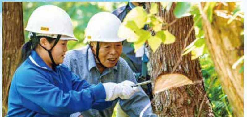
③「追い口」にくさびを少しずつ打ち込んで倒します。