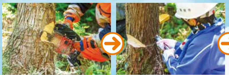
①倒したい方向に向けて、チェーンソーで「受け口」を作ります。 ②「受け口」の反対側に、「追い口」を作ります。 ↑今回は鋸(のこ)を使って体験