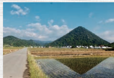
富神山