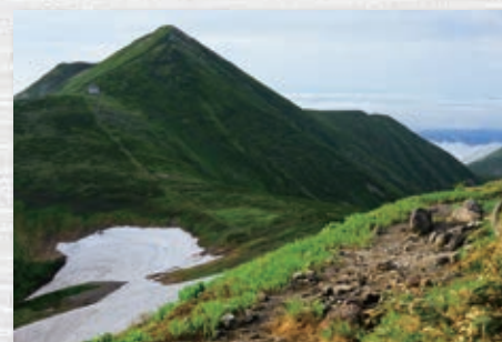
大朝日岳