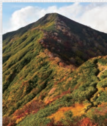
小朝日岳