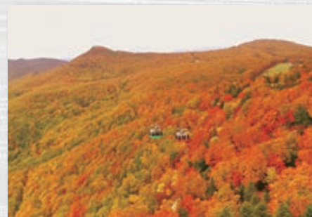
蔵王・烏兜山