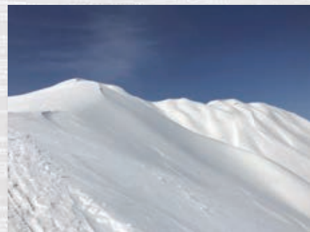
湯殿山