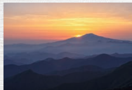
神室山から望む鳥海山