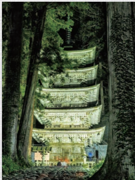
羽黒山五重塔