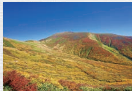
月山