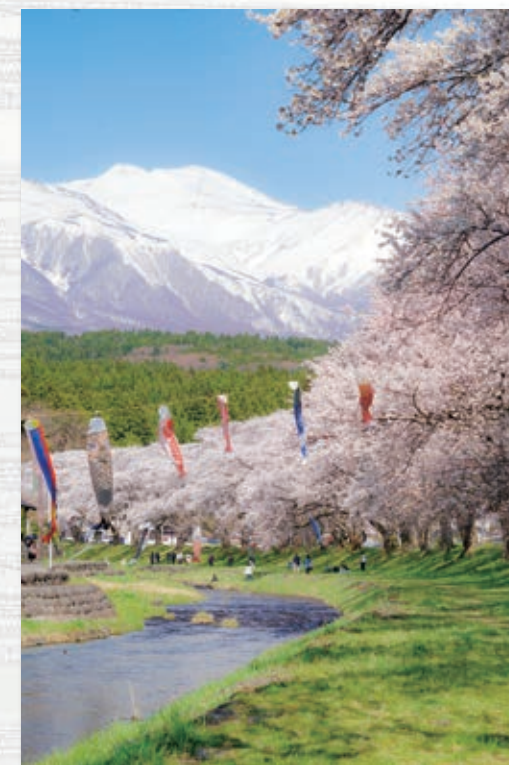
鳥海山