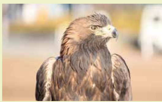
凛々しい表情のイヌワシ

生き物や森の話をするとき、一度手を加えた森はちゃんと管理しないと機能していかないと話をします。また、木が混みすぎてイヌワシが住みづらい森になってしまいます。そういう話をすると、じゃあ自分たちにはなにができるかと皆さん考えてくれるんです。そんなと