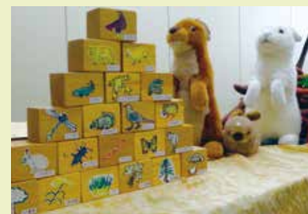
生態系ピラミッドを表した積み木

山ではネイチャーゲームや身近な生き物の観察会をします。また、暑い季節には川遊びやキャンプをします。ただ流れるもよし、水中の生き物を捕まえるのもよし、皆さん思い思いに楽しんでます。スタッフとしては、初めての人も安心して楽しく体験ができるように、安全対策には特に気を配っています。